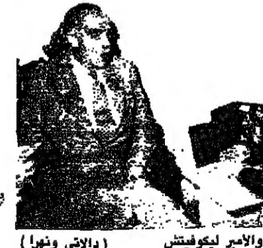
الرئيس الحصّ والامير ليكوفيتش (دالاي ونورا)

استقبل الرئيس الدكتور صلاح الحصّ امس رئيس منظمة فرسان مالطا في بيروت الامير اورد دي ليكوفيتش الذي اتقى بالقول: